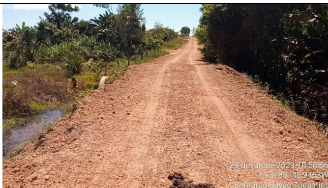
2. GLEBA "M" – 7.9378 S – 48.9463 W BUEIRO SIMPLES - Ø 100CM - RIBINHA