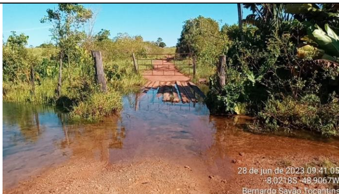
8. GLEBA "O" – 8.0218 S – 48.9067 W BUEIRO DUPLO - Ø 100CM - ZEZE