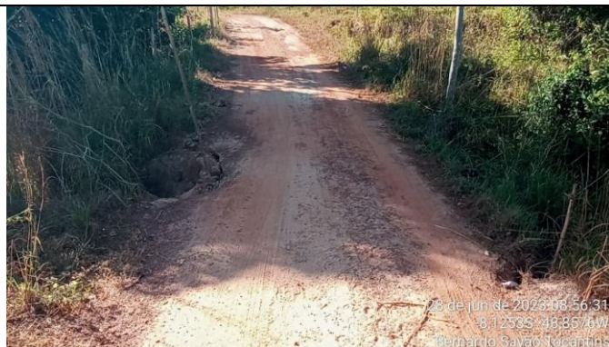
9. SETOR 70 PA – 8.1253 S – 48.8576 W BUEIRO SIMPLES - Ø 100CM - VANDIN