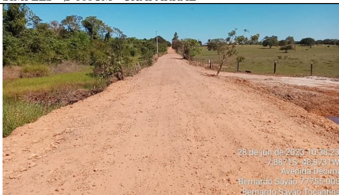
6. GLEBA "R" – 7.8871 S - 48.8731 W BUEIRO DUPLO - Ø 100CM - DR. DOMINGOS