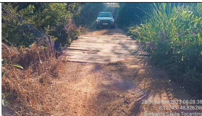
10. SETOR 100 PA – 8.1274 S – 48.8262 W BUEIRO DUPLO - Ø 100CM - ANTONIO FISCAL

Bernardo Sayão – TO, 06 de julho de 2023.