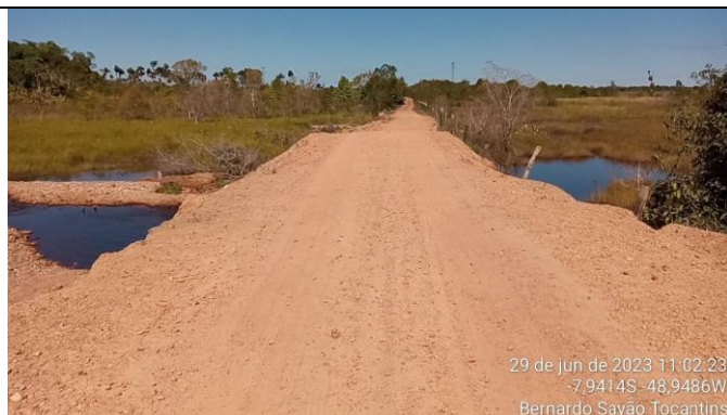
3. GLEBA "M" – 7.9414 S – 48.9486 W - BUEIRO DUPLO - Ø 100CM - MOACIR